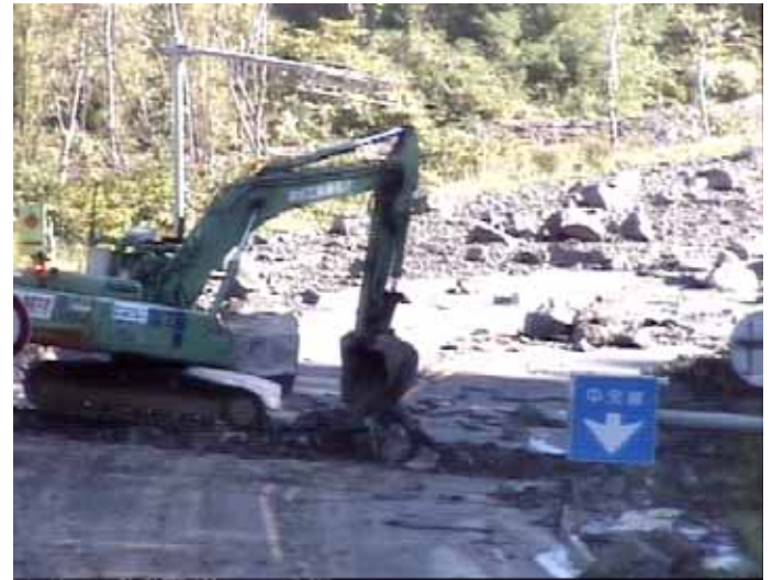
噴石を撤去中の無人機械