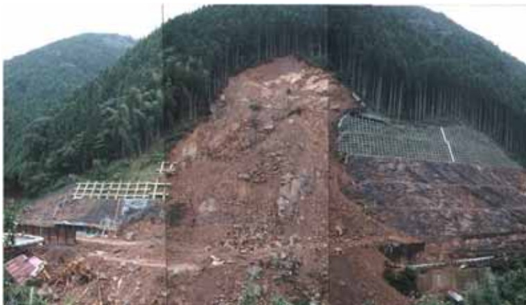
崩壊が続く中で山腹に登坂路設置中の無人機械