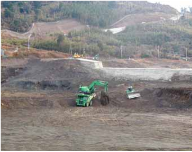
砂防ダム堆砂敷を無人機械で掘削・運搬 地区外へ搬出