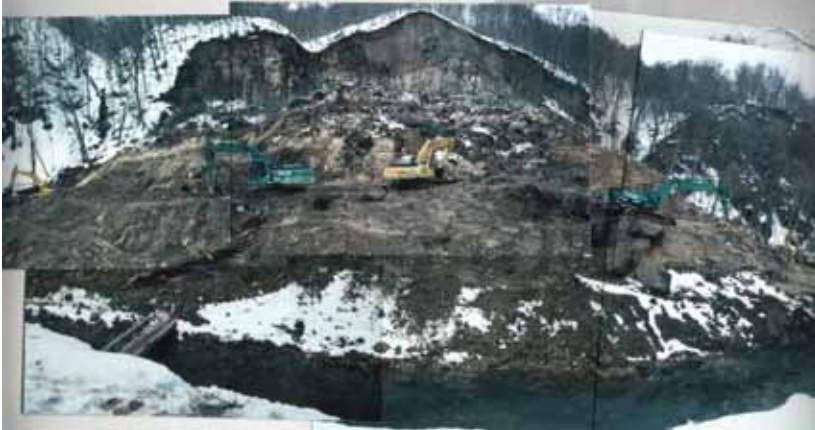
無人機械による崩壊土砂の撤去作業中