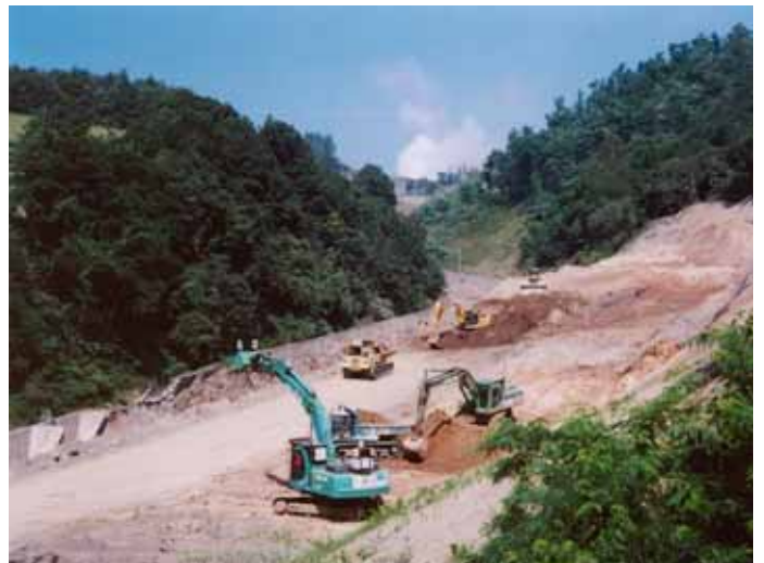
火山灰等が降雨による土石流被害防止の為、仮設沈砂池施工中の無人機械