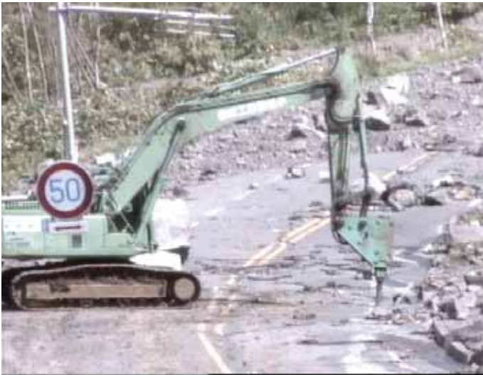
噴石を撤去中の無人機械