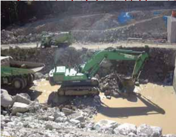
土石流で埋設した河川を浚渫中の無人機械