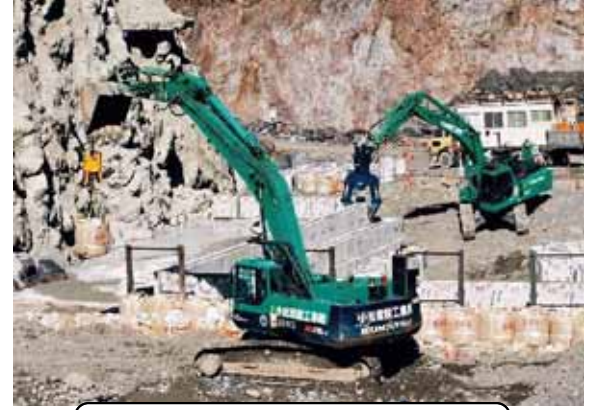
崩壊した場所に土留ブロック 1 t土のうを施工中の無人機械